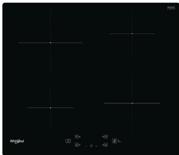
Table de cuisson à induction Whirlpool - WS Q2160 NE

4 feux à induction. cette table de cuisson à induction Whirlpool présente les caractéristiques suivantes : Une technologie toute en élégance qui chauffe la poêle, pas la plaque, ce qui limite la dperdition énergétique et permet une cuisson parfaite. Alimentation électrique.